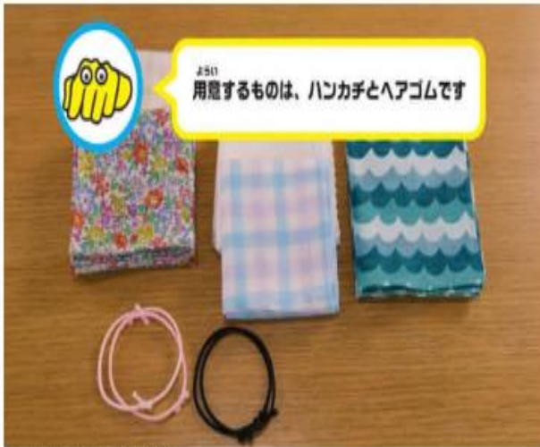
マスク製作にひつようなもの