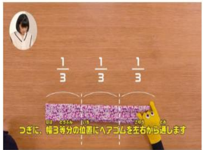
ヘアゴムを通して折りたためば完成