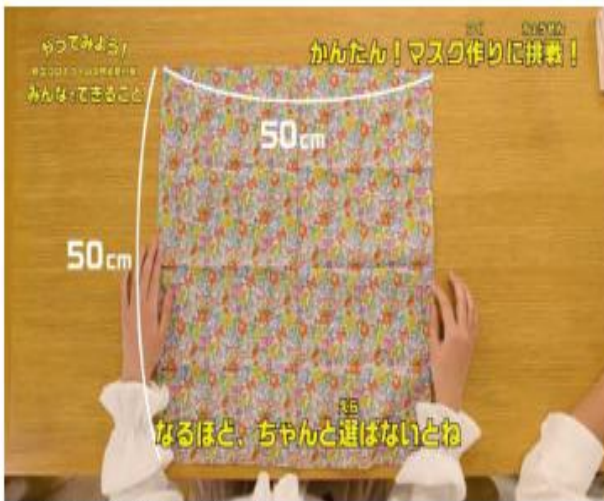
ハンカチは大きめで目が細かいものを