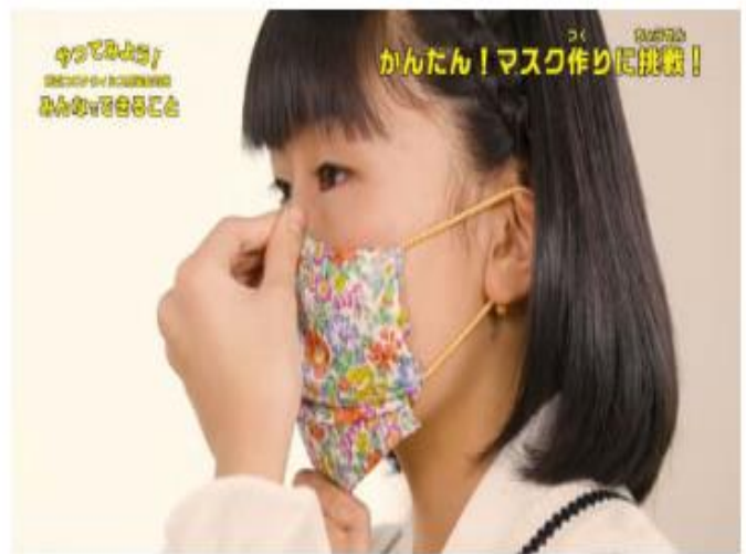
市販マスクのようにマスクの下側をひっぱって調整できる