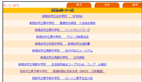
【生徒が投稿する職場体験レポートのページ】

ジョブチャレ Web サイト URL 【 https://ehime-jcu15.com 】