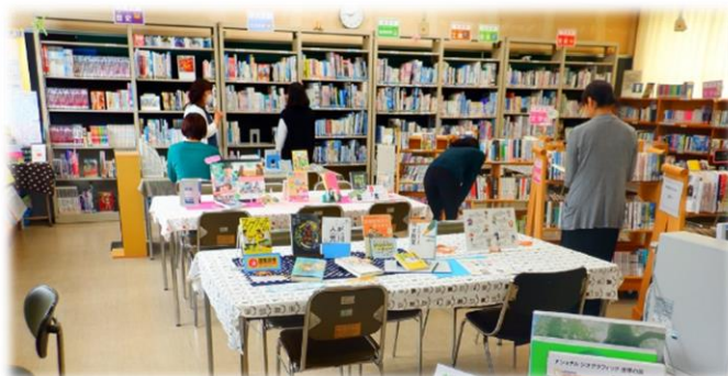
【参観日の保護者の利用風景】