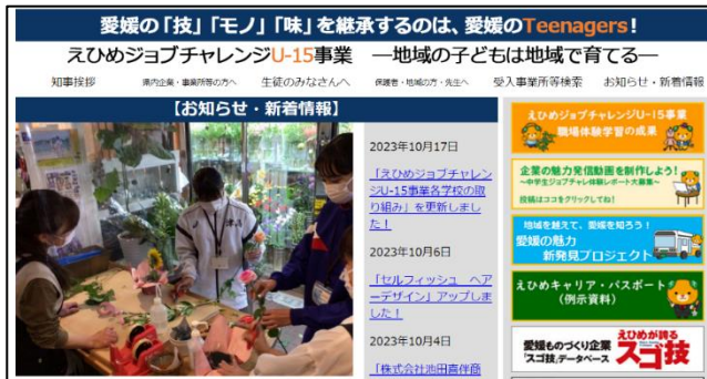
【ジョブチャレ Web サイトホーム画面】

9月末現在、約55%の中学校が職場体験学習を終えています。御提出いただいた実施報告や生徒が投稿した体験レポートは、随時ジョブチャレ Web サイトに掲載しています。また、生徒の体験レポートから選定した企業等の仕事を紹介する「企業の魅力発信動画」は、現在制作中で、順次掲載します。自校の活動を振り返ったり、他校の取組を参考にしたりすることができるほか、いろいろな職業に触れることができる内容になっています。職場体験学習の事後指導や来年度の職場体験学習の事前指導に、ぜひ御活用ください。