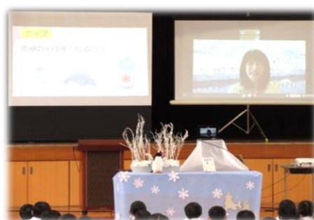
【読書への関心を高める全校集会】