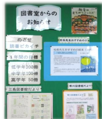
【読書意欲を高めるお知らせコーナー】