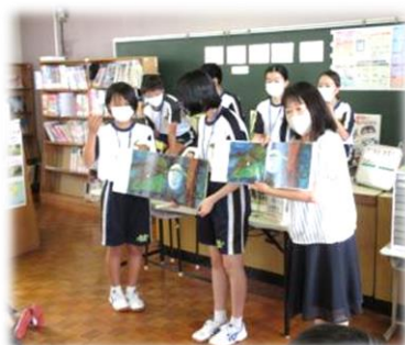
【昼休みの読み聞かせ】