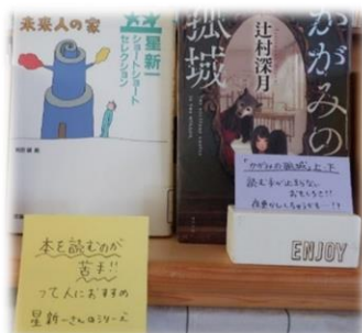
【興味を持たせるポップ】