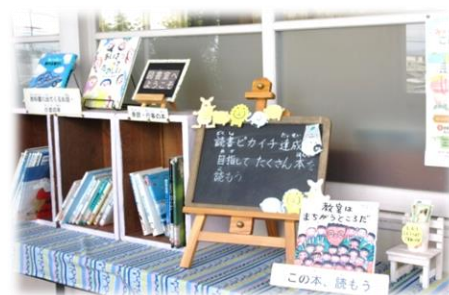
【新着本をディスプレイした学校図書館の入り口】