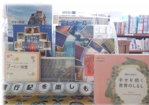
【書架のレイアウト】