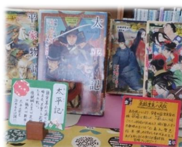
【授業に関連する本のコーナー】