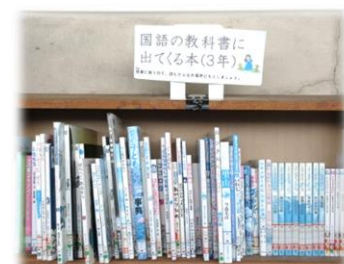
【並行読書のコーナー】

全校で取り組んでいるSDGsに関する図書の著者とオンラインでつないで全校集会を実施。